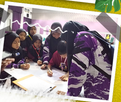
AKTIVITI SK LEMBAH BIDONG : EDURACE 3M