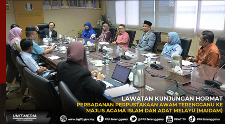
LAWATAN KUNJUNGAN HORMAT PERBADANAN PERPUSTAKAAN AWAM TERENGGANU KE MAJLIS AGAMA ISLAM DAN ADAT MELAYU (MAIDAM)

www.trgib.gov.my PPA Terengganu @PPATerengganu PPAT TV PPA Terengganu