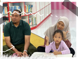
JOM BELAJAR BAHASA INGERIS