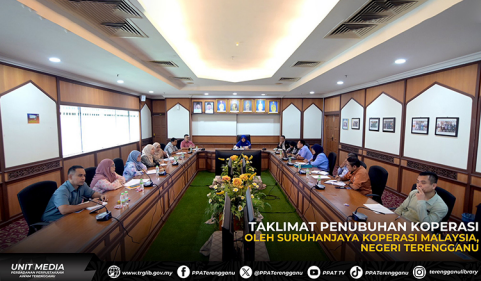
TAKLIMAT PENUBUHAN KOPERASI OLEH SURUHANJAYA KOPERASI MALAYSIA, NEGERI TERENGGANU

Taklimat ini bukan sahaja menambahkan pengetahuan peserta tentang selok-belok penubuhan koperasi, malah turut membuka ruang kesedaran tentang potensi koperasi dalam memperkukuhkan ekonomi ahlinya.