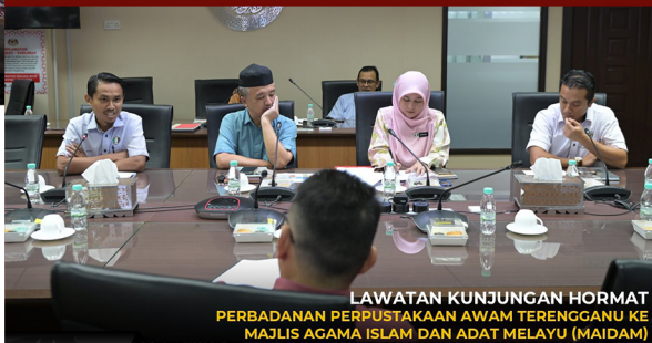
LAWATAN KUNJUNGAN HORMAT PERBADANAN PERPUSTAKAAN AWAM TERENGGANU KE MAJLIS AGAMA ISLAM DAN ADAT MELAYU (MAIDAM)

22 September 2025, Isnin – Perbadanan Perpustakaan Awam Terengganu (PPAT) telah mengadakan kunjungan hormat ke Majlis Agama Islam dan Adat Melayu Terengganu (MAIDAM) sebagai sebahagian daripada agenda memperkukuh jaringan strategik antara institusi negeri.