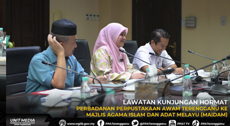
LAWATAN KUNJUNGAN HORMAT PERBADANAN PERPUSTAKAAN AWAM TERENGGANU KE MAJLIS AGAMA ISLAM DAN ADAT MELAYU (MAIDAM)

www.trgib.gov.my PPA Terengganu @PPATerengganu PPAT TV PPA Terengganu