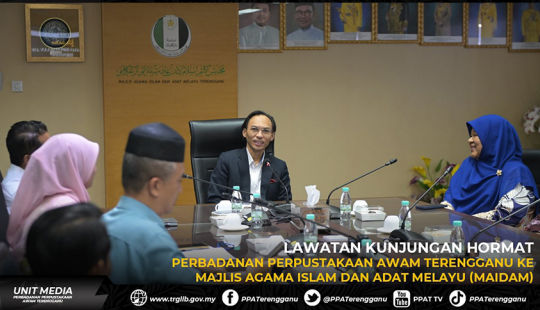
LAWATAN KUNJUNGAN HORMAT PERBADANAN PERPUSTAKAAN AWAM TERENGGANU KE MAJLIS AGAMA ISLAM DAN ADAT MELAYU (MAIDAM)

www.trgib.gov.my PPA Terengganu @PPATerengganu PPAT TV PPA Terengganu