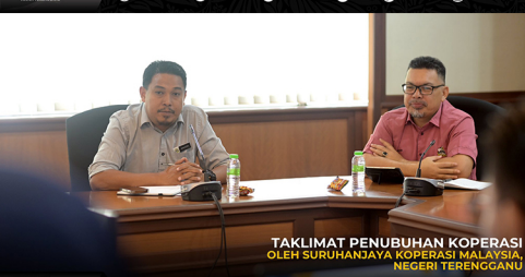
TAKLIMAT PENUBUHAN KOPERASI OLEH SURUHANJAYA KOPERASI MALAYSIA, NEGERI TERENGGANU