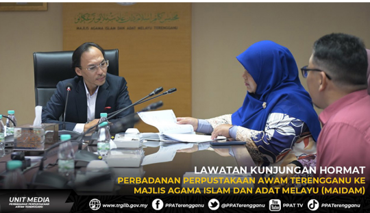
LAWATAN KUNJUNGAN HORMAT PERBADANAN PERPUSTAKAAN AWAM TERENGGANU KE MAJLIS AGAMA ISLAM DAN ADAT MELAYU (MAIDAM)

Melalui jalinan kerjasama erat bersama MAIDAM, PPAT optimis dapat mengukuhkan ekosistem ilmu di negeri Terengganu, sekaligus menyokong agenda kerajaan negeri dalam melahirkan masyarakat yang berpengetahuan, berakhlak mulia dan berdaya saing.