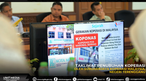
TAKLIMAT PENUBUHAN KOPERASI OLEH SURUHANJAYA KOPERASI MALAYSIA, NEGERI TERENGGANU