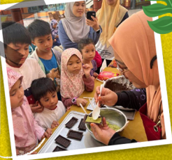
DEMONSTRASI MASAKAN KUNAFI DAN CHOCO JAR