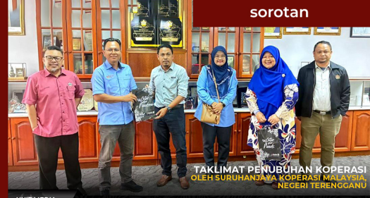
TAKLIMAT PENUBUHAN KOPERASI OLEH SURUHANJAYA KOPERASI MALAYSIA, NEGERI TERENGGANU