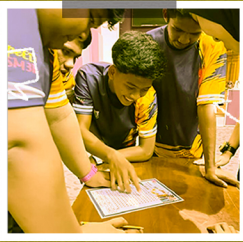
AKTIVITI PENDIDIKAN KHAS BERSAMA SMK KUALA KRAI