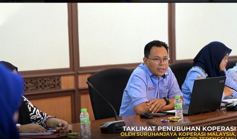
TAKLIMAT PENUBUHAN KOPERASI OLEH SURUHANJAYA KOPERASI MALAYSIA, NEGERI TERENGGANU