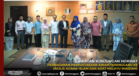
LAWATAN KUNJUNGAN HORMAT PERBADANAN PERPUSTAKAAN AWAM TERENGGANU KE MAJLIS AGAMA ISLAM DAN ADAT MELAYU (MAIDAM)

www.trgib.gov.my PPA Terengganu @PPATerengganu PPAT TV PPA Terengganu