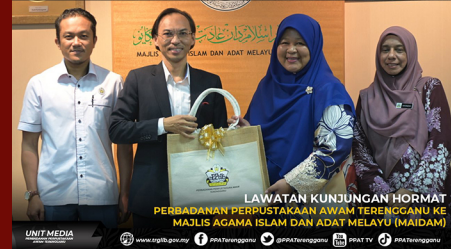
LAWATAN KUNJUNGAN HORMAT PERBADANAN PERPUSTAKAAN AWAM TERENGGANU KE MAJLIS AGAMA ISLAM DAN ADAT MELAYU (MAIDAM)

www.trgib.gov.my PPA Terengganu @PPATerengganu PPAT TV PPA Terengganu