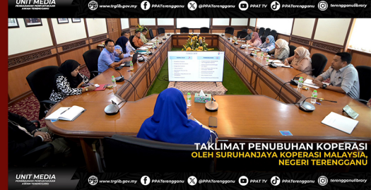
TAKLIMAT PENUBUHAN KOPERASI OLEH SURUHANJAYA KOPERASI MALAYSIA, NEGERI TERENGGANU