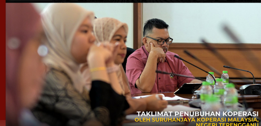
TAKLIMAT PENUBUHAN KOPERASI OLEH SURUHANJAYA KOPERASI MALAYSIA, NEGERI TERENGGANU