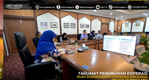
TAKLIMAT PENUBUHAN KOPERASI OLEH SURUHANJAYA KOPERASI MALAYSIA, NEGERI TERENGGANU